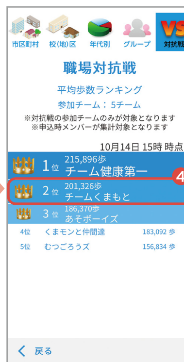
④自分のグループ名をタップ 参加メンバーの順位を確認