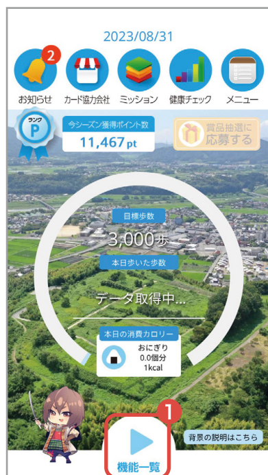
①「機能一覧」をタップ