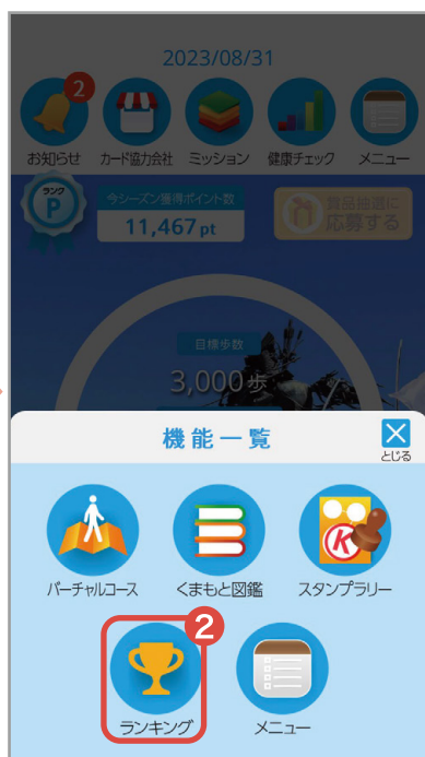
②「ランキング」をタップ